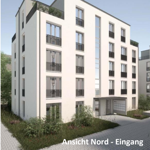
Ansicht Nord - Eingang