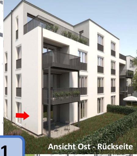
Ansicht Ost - Rückseite