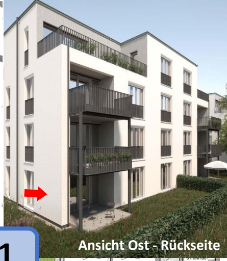
Ansicht Ost - Rückseite