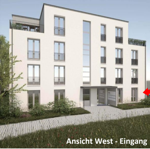
Ansicht West - Eingang