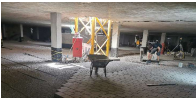
Pflastern von Hand...

Gleichzeitig geht es unter der Erde voran und auch die Tiefgarage und die Kellerbereiche nehmen langsam Gestalt an.