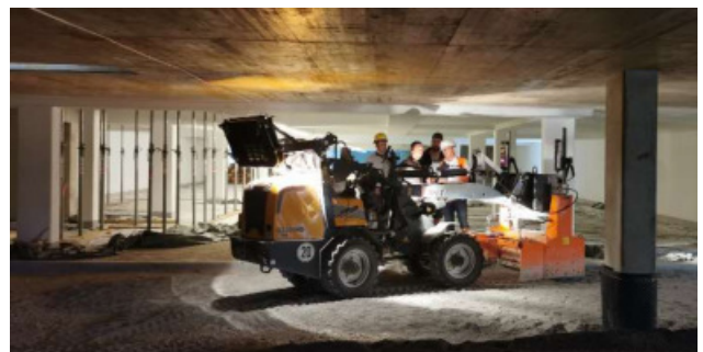
...und mit schwerem Gerät.