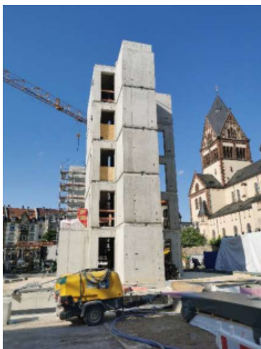
Der letzte „nackte“ Treppenturm

Während bereits vier Häuser im Holzbau stehen, ragt der letzte noch freie Treppenturm neben der Bonifatiuskirche in die Höhe. In wenigen Wochen wird auch er Teil eines 5 geschossigen Wohnhauses sein.