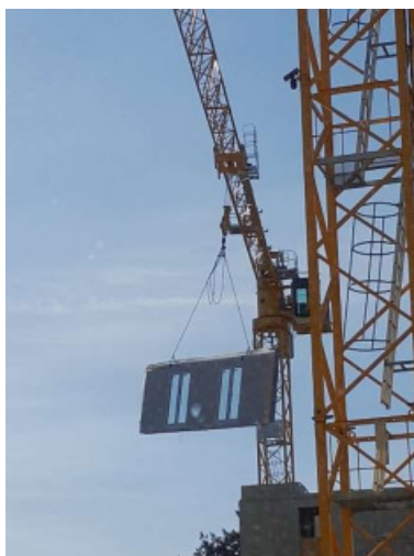
Eine Holzwand kurz vor dem Einbau